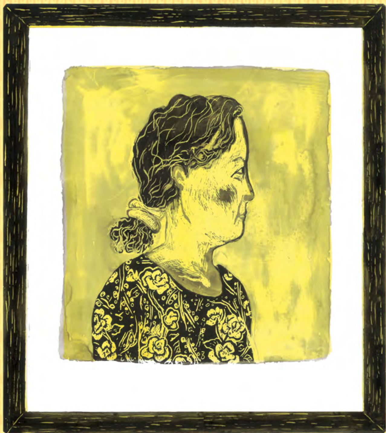
在媽媽媽媽熟悉的樣貌中，