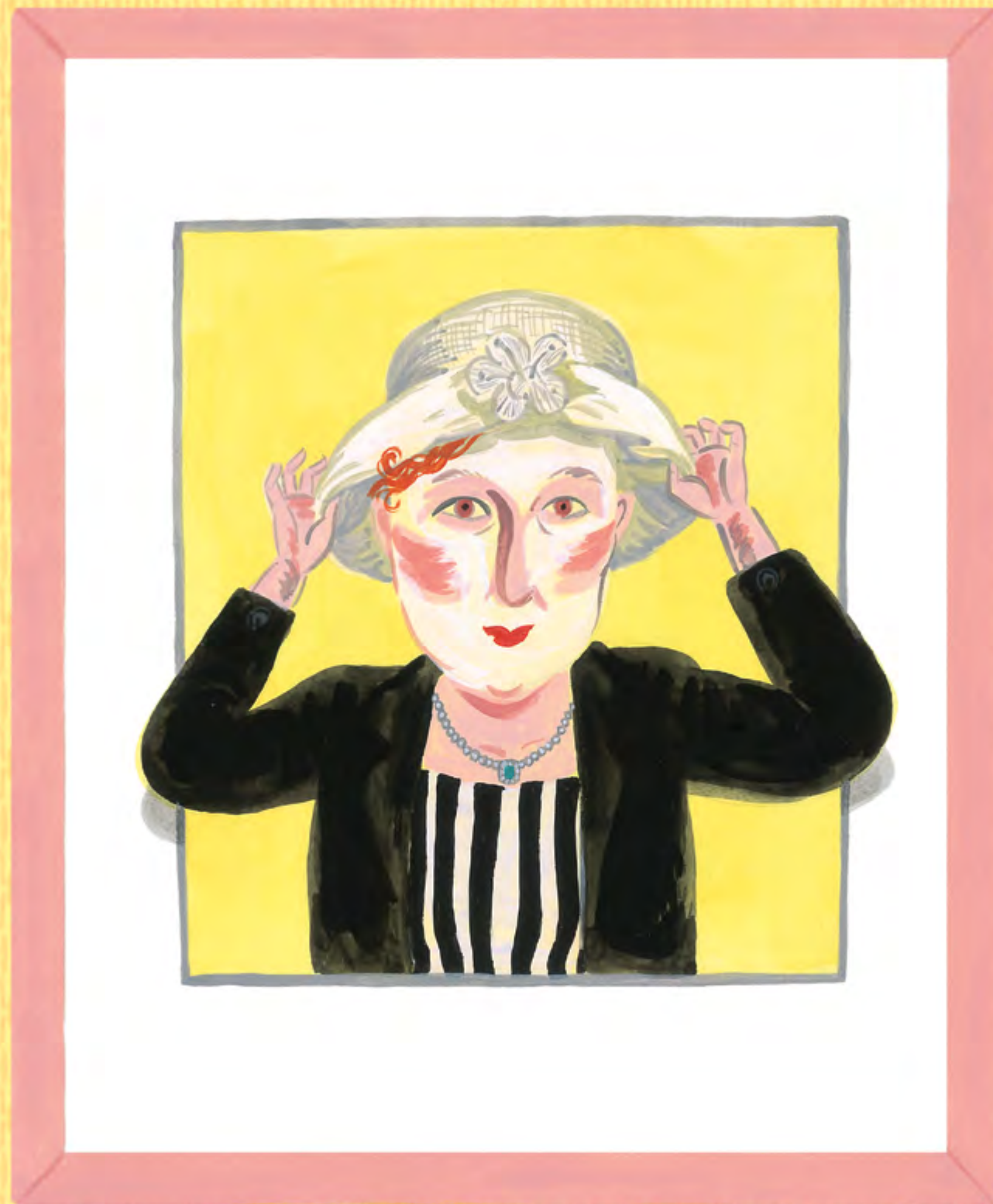
有著美英陌生的身影。