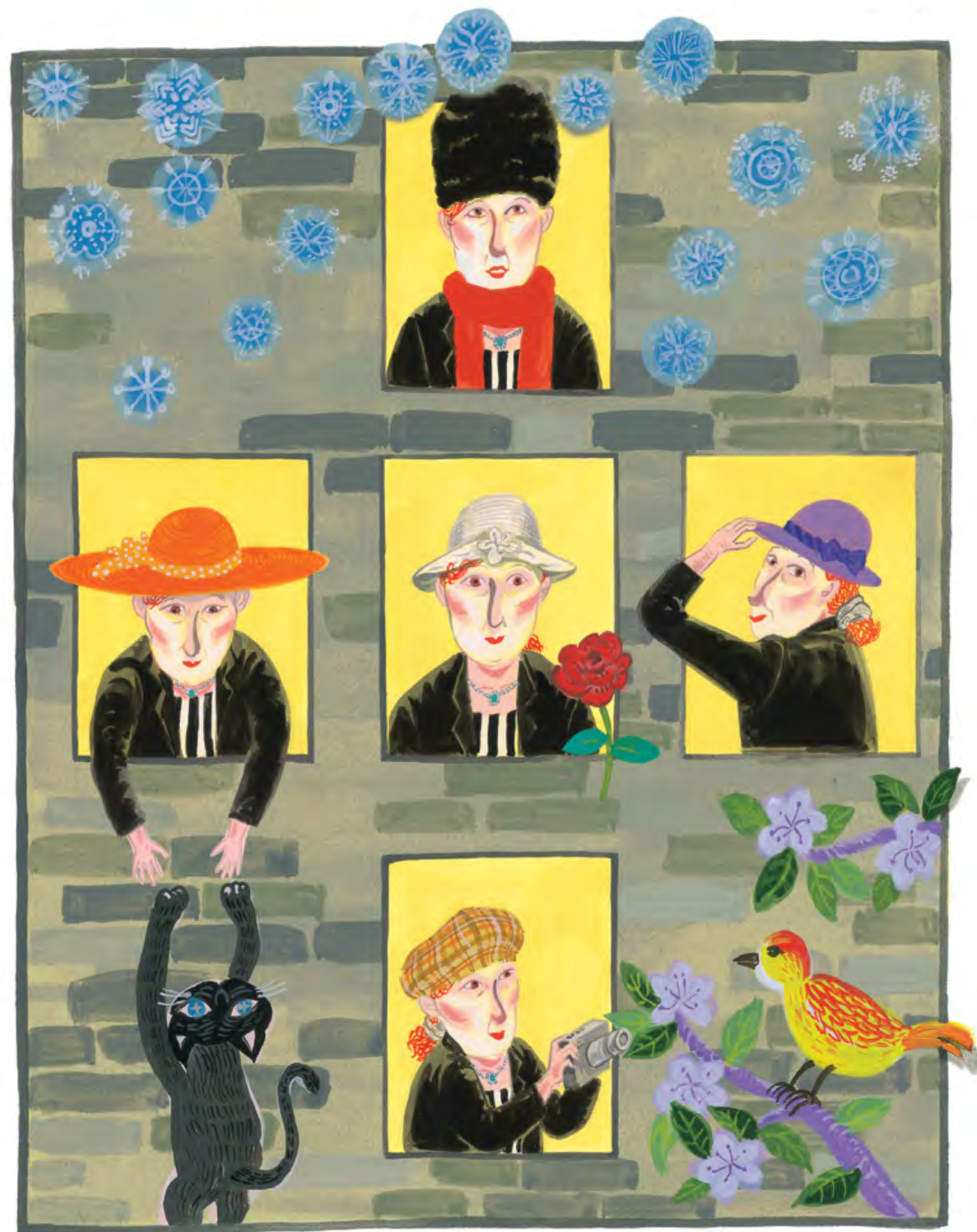
美英們用漂亮的帽子遮掩粗心。