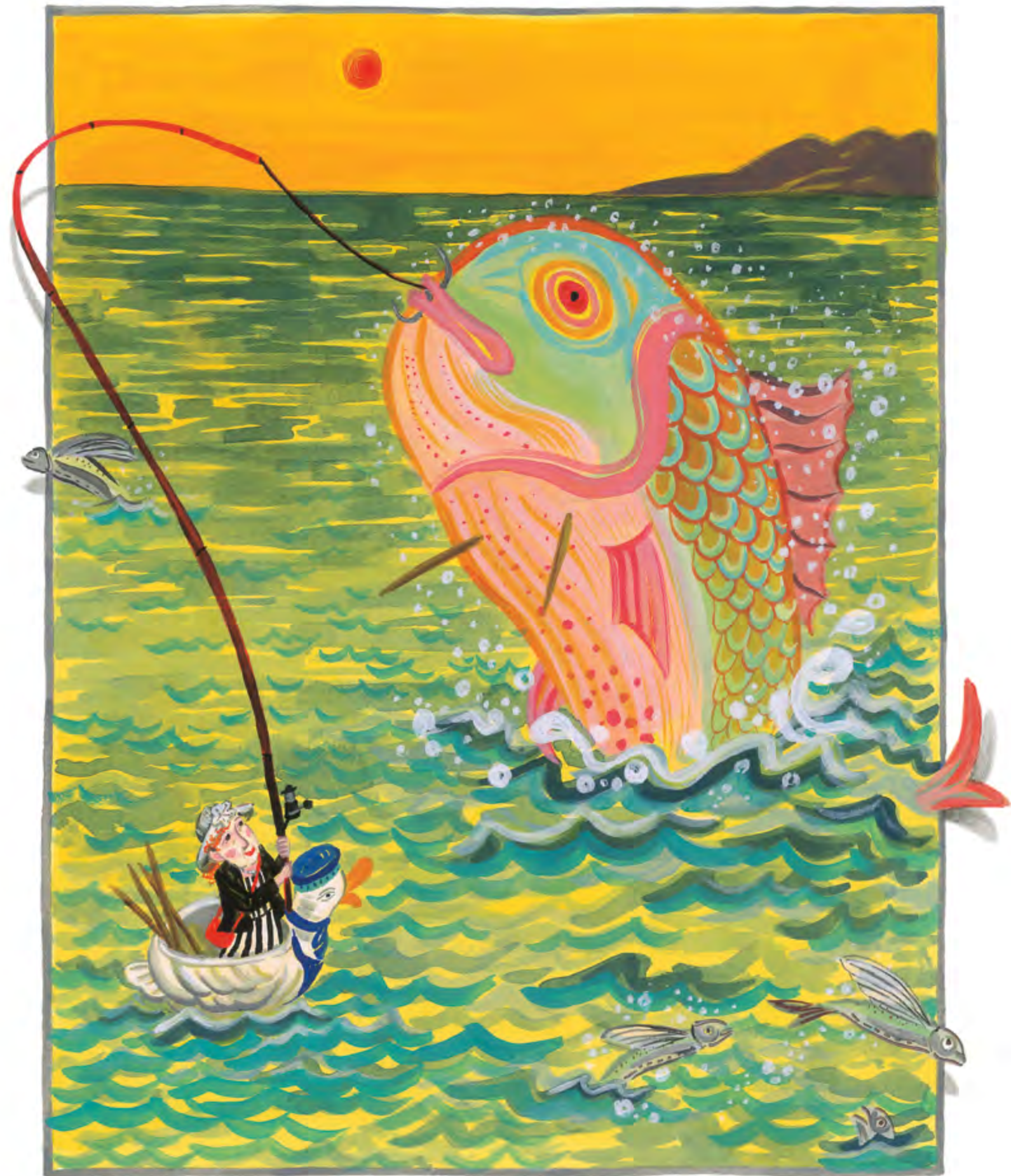
美英是什麼也不怕的探險家。