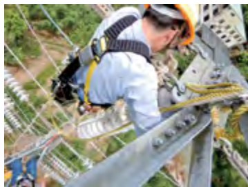
▲保線員執行任務

從事各種維護工作時，前一天工作人員要先閱讀工作指導書(SOP)，工作當天會再開任務行前的工具箱會議，因為需要提前讓保線員知道每次任務的危險所在，並告知安全的工作程序，現場還會再次確認。有經驗的前輩也會特別叮嚀指導新進人員安全須知與工作技巧，達成自我保護、互助保護和監督保護的工作安